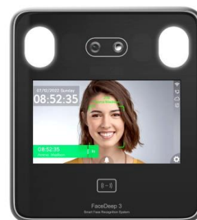
TS-400 mit Gesichtserkennung

Damit wird der Einsatz der Terminals mit Gesichtserkennung (TS-400) noch flexibler und komfortabler.